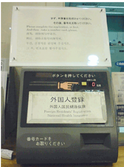
【中野区 - 券売機】

調査から、区役所内の機器本体に表示される言語は、最大2カ国語（日本語・英語）で対応できることわかった。また機器本体ではなく、案内や注意書きという形で対応をするケースでは、最大で4カ国語（日本語・英語・中国語・韓国語）を使用していた。区の特徴を踏まえ、さまざまな外国籍の利用者に配慮した表示といえる。