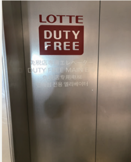
写真1.東急プラザ銀座 免税店専用エレベーター

しかし、写真1のように免税店専用エレベーターの場合は明確に外国人向けであるため、例外として多言語表示になったと思われる。