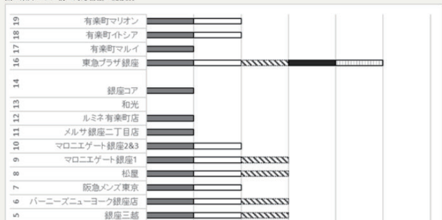
図1.乗降エリア前に対応言語の施設別